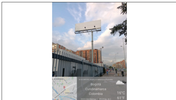
Foto 1. Vista panorámica del lugar donde se ubica la valla en la Avenida Carrera 68 N° 95-85 orientación SUR- NORTE.