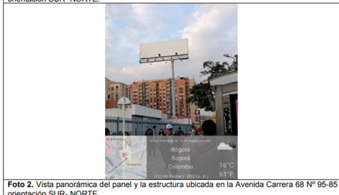
Foto 2. Vista panorámica del panel y la estructura ubicada en la Avenida Carrera 68 N° 95-85 orientación SUR- NORTE.