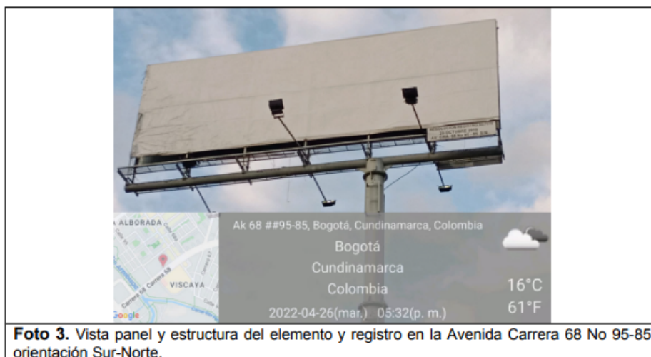
Foto 3. Vista panel y estructura del elemento y registro en la Avenida Carrera 68 No 95-85 orientación Sur-Norte.